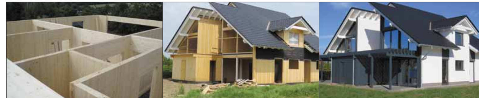
Sec et massif