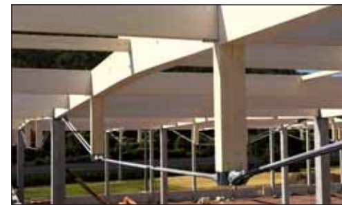
Poutres sous-tendues · Waldkirch

Si vous le souhaitez, nous vous proposons également votre projet en version semi-finie ou clé en main.