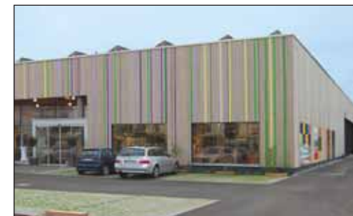
Centre du bois · Kempten