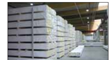
Le plus grand entrepôt de bois lamellé-collé d'Europe