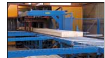
L'usinage en CNC offre un haut niveau de précision lors du montage