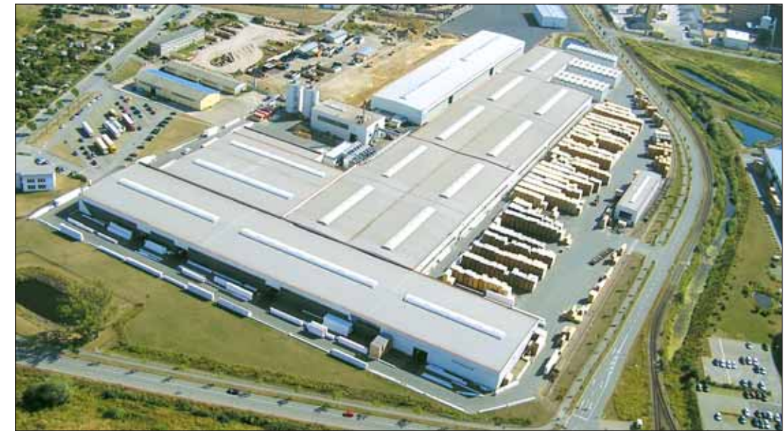
Hüttemann Wismar GmbH & Co. KG

L'usine créée en 1999 à Wismar fabrique des poutres droites de bois lamellé-collé et des éléments HBE pour la construction en bois massif