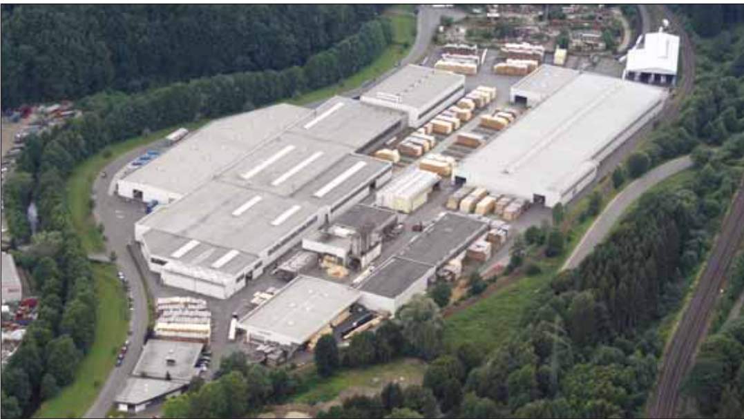
Hüttemann Holz GmbH & Co. KG, Olsberg

Le groupe Hüttemann, fondé en 1891, représente la quatrième génération de cette entreprise familiale et possède deux sites en Allemagne.