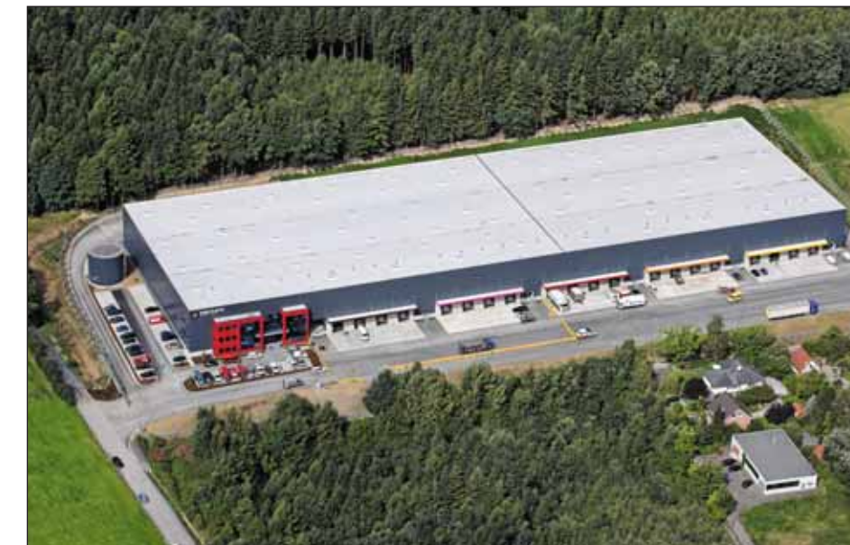
Trilux · Arnberg