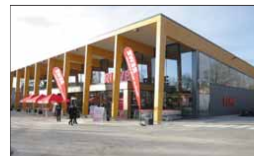
REWE · Hambourg